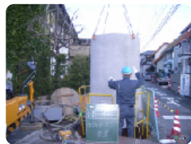
躯体ブロック設置