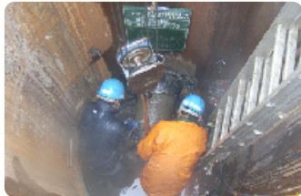
先薄体分割回収状況