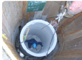
躯体ブロック設置